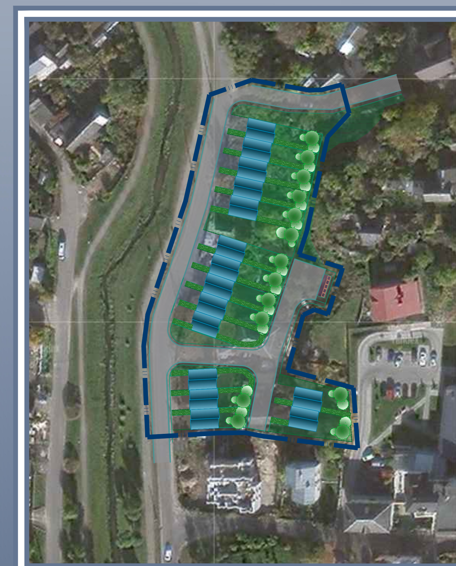
Застройка таунхасами. Вид сверху