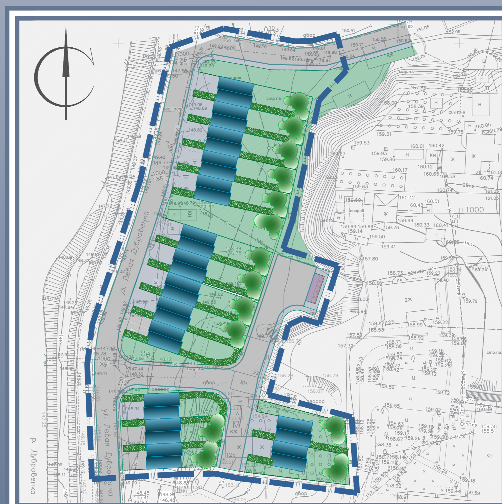
Застройка таунхасами. Схема генплана