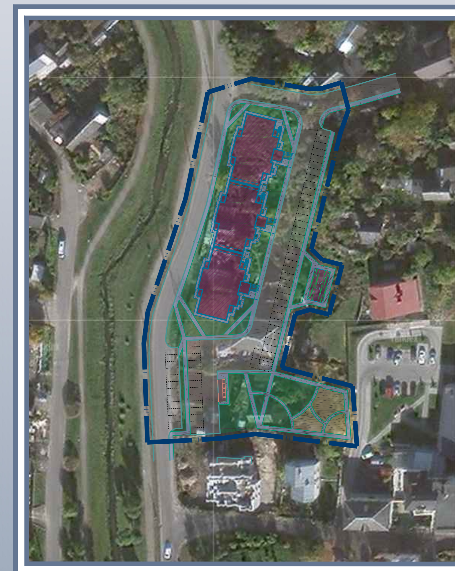
Малоэтажная застройка. Вид сверху