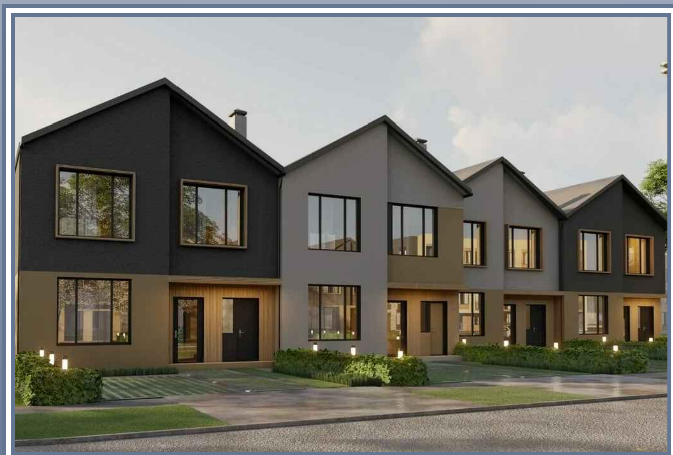
Застройка таунхасами. Перспективный вид