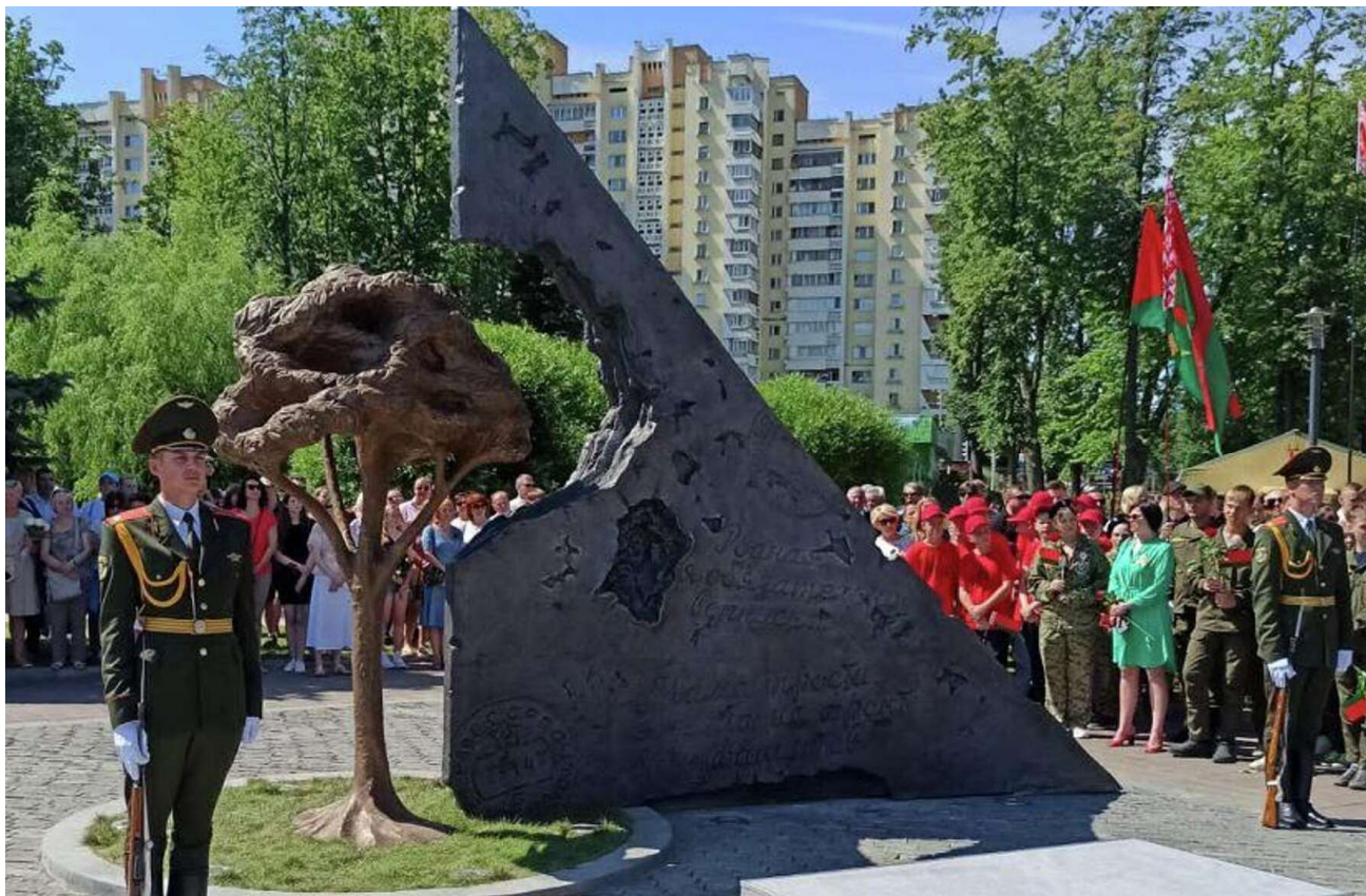
Первый знак был установлен 3 июля 2022 года на набережной в парке Победы в городе Минске ко Дню Независимости Республики Беларусь.

В рамках первого этапа проекта было собрано более 130 000 монет. За время создания памятника в г. Минске проект поддержало более 500 организаций и более 100 000 семей Беларуси.