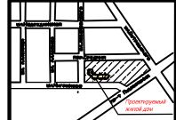
Схема расположения участка