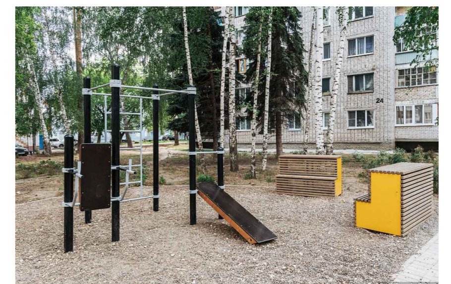
Детские площадки, площадки для отдыха