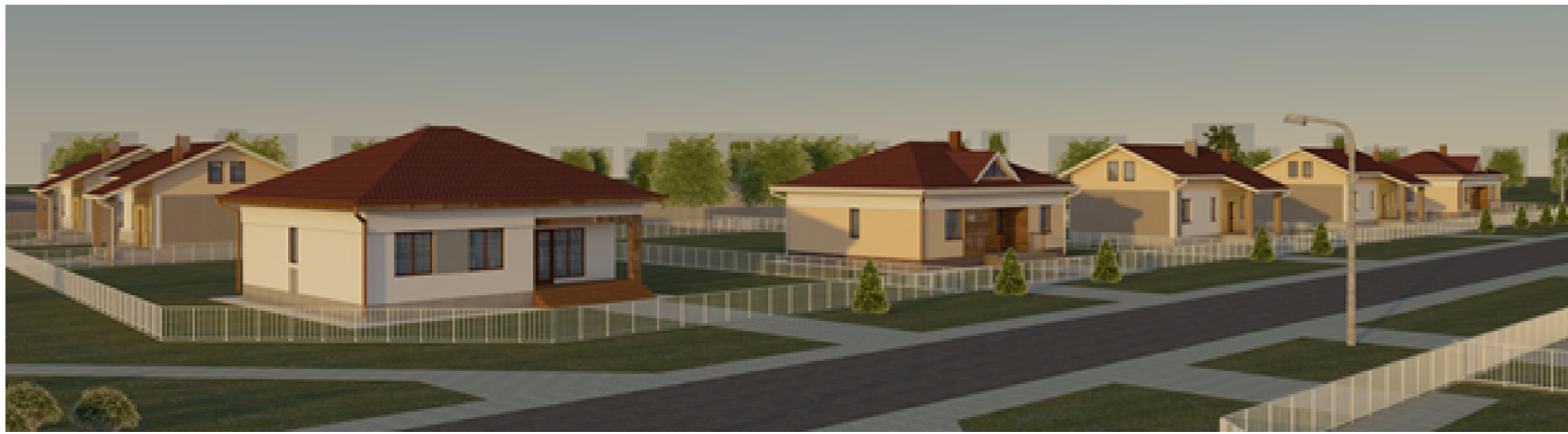
Схема детального плана