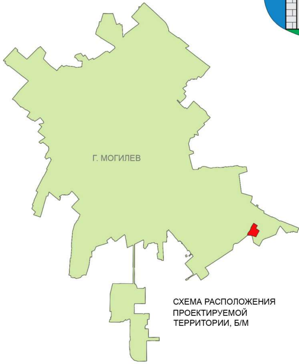
СХЕМА РАСПОЛОЖЕНИЯ ПРОЕКТИРУЕМОЙ ТЕРРИТОРИИ, Б/М